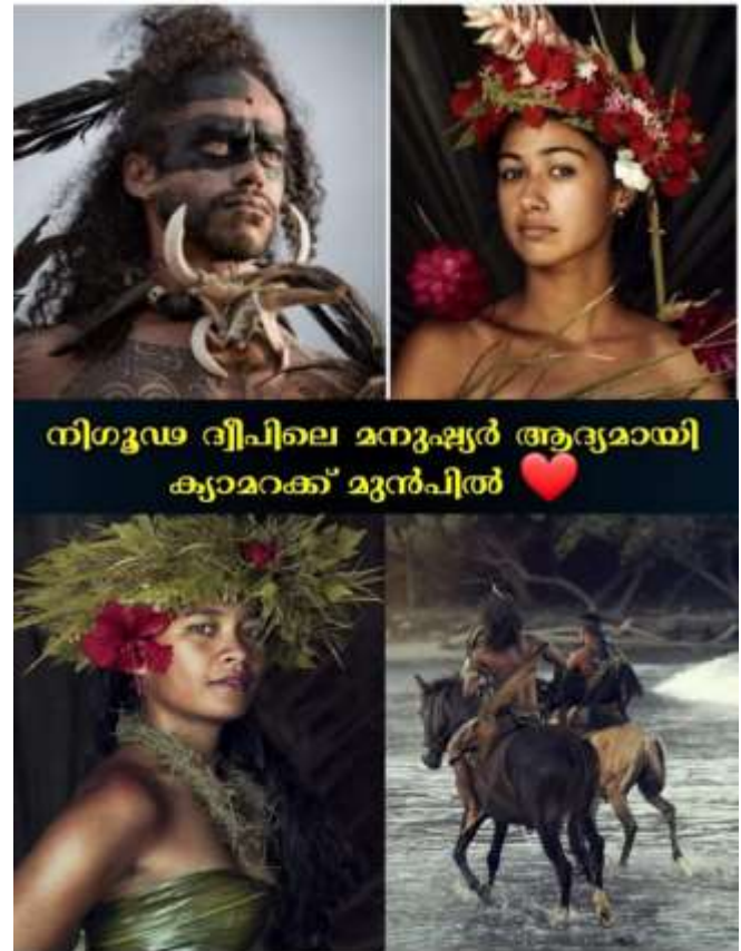
നിഗൂഡ ദ്വീപിലെ മനുഷ്യർ ആദ്യമായി ക്യാമറക്ക് മുൻപിൽ

ദേഹത്ത് നിറയെ പച്ചകുത്തുന്ന സ്വഭാവക്കാരാണ് ഇവരിലെ പുരുഷന്മാർ. ഇലകളും പൂക്കളും ഒക്കെകൊണ്ടാണ് സ്ത്രീപുരുഷന്മാർ നാണം മറയ്ക്കുന്നത്. കുതിരപ്പുറത്താണ് സ്ഥിരമായി. പന്ത്രണ്ട് ദ്വീപുകൾ ഉള്ളതിൽ ആകെ ആറെണ്ണത്തിൽ മാത്രമേ ജനവാസമുള്ളൂ. ഏറ്റവും അടുത്തുള്ള പരിഷ്കാരത്തിന്റെ പച്ചപ്പ്, 880 കിലോമീറ്റർ അകലെ കിടക്കുന്ന ഫ്രഞ്ച് പോളിനേഷ്യൻ ടൂറിസ്റ്റ് കേന്ദ്രമായ താഹിതി ആണ്. അത് ഇവിടെ നിന്ന് നാലുമണിക്കൂറെങ്കിലും പറന്നാൽ മാത്രമേ എത്തൂ. ആംസ്റ്റർഡാം കേന്ദ്രീകരിച്ചു പ്രവർത്തിക്കുന്ന 53 കാരനായ ജിമ്മി ഗോത്രവർഗ്ഗക്കാരുടെ ചിത്രങ്ങൾ എടുക്കുന്നതിൽ പ്രസിദ്ധിയാർജ്ജിച്ച ഒരു പ്രൊഫഷണൽ ഫോട്ടോഗ്രാഫർ ആണ്.