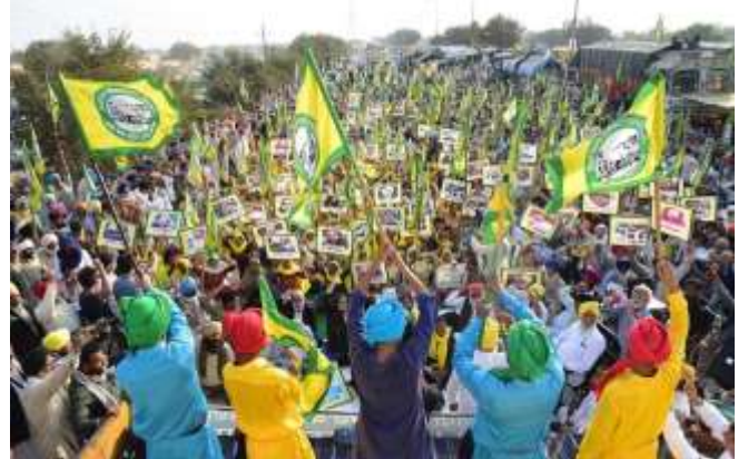
'Dilli Chalo' "ദില്ലി ചലോ" സമരമുഖം

ഓരോ പിടി ചോറിന്റെ പുറകിലും ഒരു കർഷകന്റെ ചെളി പുരണ്ട കരങ്ങൾ ഉണ്ട്, ആ കരങ്ങളിൽ ചെളി പുരണ്ടില്ലെങ്കിൽ അന്നം മുട്ടും.