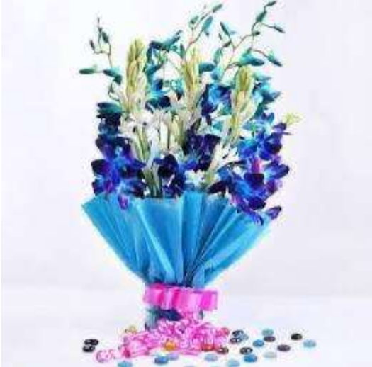
ഒരിക്കൽ കൂടി എല്ലാവർക്കും ആശംസകൾ നേരുന്നു.

ജീവിതത്തിന്റെ ഒരു ഭാഗമായിരുന്ന വലിയ ഒരു ബാങ്കിംഗ് പ്രസ്ഥാനത്തോട് നല്ല ഓർമ്മകളുമായി വിട പറയുന്നു എല്ലാവർക്കും ബാങ്ക് ഔദ്യോഗികമായി യാത്രയയപ്പ് തന്നിട്ടുണ്ടാവും. അതിന് സാക്ഷികളാകണമെന്നു നിങ്ങളുടെ സീനിയർസ് ആയ ഞങ്ങൾക്ക് എല്ലാവർക്കും ആഗ്രഹമുണ്ടായിരുന്നു പക്ഷേ ഇന്നത്തെ പ്രത്യേക സാഹചര്യത്തിൽ അതിന് സാധിച്ചില്ല. ഇനിയുള്ള നിങ്ങളുടെ രണ്ടാം ഇന്നിംഗ്സിൽ നിങ്ങൾക്ക് ഒരു തണലായി നമ്മുടെ പെൻഷനേഴ്സ് അസോസിയേഷൻ നിങ്ങളുടെ കൂടെയുണ്ട്. എല്ലാവരെയും ഈ സംഘടനയിലേക്ക് സ്വാഗതം ചെയ്യുന്നു.