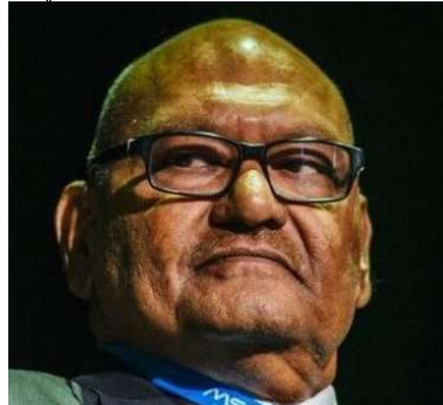
വേദാന്ത റിസോഴ്സസ് ചെയർമാൻ ശ്രീ. അനിൽ അഗർവാൾ

ഇന്ത്യൻ വ്യവസായി അനിൽ അഗർവാൾ പൊതുമേഖലാ സ്ഥാപനങ്ങൾ വൻതോതിൽ ഏറ്റെടുക്കാനൊരുങ്ങുന്നു.