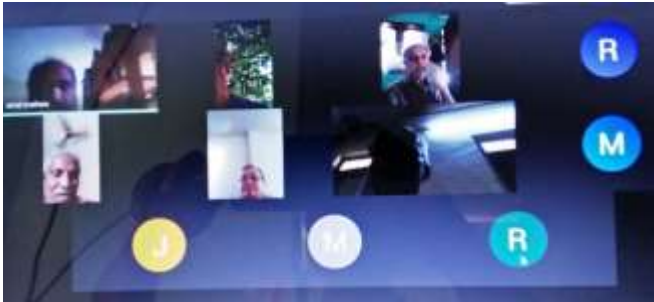
കോട്ടയം എക്സിക്യൂട്ടീവ് കമ്മിറ്റിയുടെ യോഗം ഡിസംബർ മാസം 11-ാം തീയതി ഓൺലൈൻ പ്ലാറ്റ്ഫോമിൽ നടത്തിയപ്പോൾ