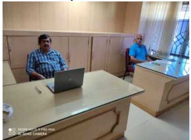
ഔദ്യോഗിക ഉദ്ഘാടനം കോവിഡ്-19 മാർഗ്ഗനിർദ്ദേശങ്ങൾക്കനുസരിച്ച് പിന്നീട് നടത്തും. ഇപ്പോൾ ഓഫീസ് പ്രവർത്തനം ആരംഭിച്ചു.