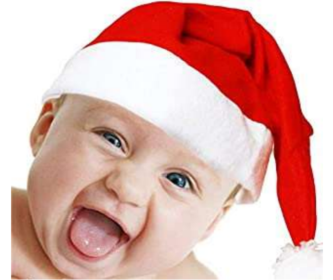
ക്രിസ്തുമസ്സ് ആശംസകൾ ...!