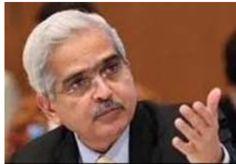
റിസർവ് ബാങ്ക് ഗവർണർ ശക്തികാന്തദാസ്

റിപ്പോ റിവേഴ്സ് റിപ്പോ നിരക്കുകൾ മാറ്റമില്ലാതെ നില നിർത്തി ആർ.ബി.ഐ. ഡിസംബർ 4-ാം തീയതി പണ വായ്പ്പാ നയം പ്രഖ്യാപിച്ചു.