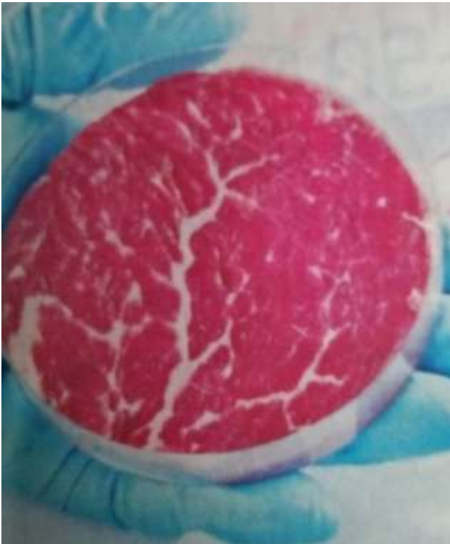
കൃത്രിമ മാംസത്തിന് വിപണനാനുമതി നൽകി സിംഗപ്പൂർ